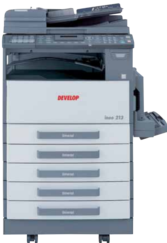
ineo 213 avec chargeur automatique de documents recto-verso DF-605, unité recto-verso AD-504, multi-bypass MB-501 et meuble support SCD-21 équipé de quatre magasins papier PF-502

La multifonctionnalité est parfois considérée comme un handicap – ceci parce que de nombreux systèmes multiplient les fonctionnalités au détriment des performances. L'ineo 163/213 s'inscrit différemment. Il offre tous les avantages de la multifonctionnalité sans aucun compromis au niveau des performances. Impression GDI et copie de premier ordre, mise en réseau optimisée, communications de bureau, ressources d'informations partagées, productivité améliorée, simplicité d'utilisation et faibles coûts d'exploitation – précisément le type d'avantages souhaités dans n'importe quelle entreprise.