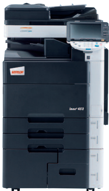
ineo+ 452 avec séparateur de travaux (JS-504)

Du choix des matériaux à la fabrication, DEVELOP met au cœur de ses préoccupations le respect de l'environnement. Ainsi, l'ineo+ 452 offre de nombreux avantages comme une consommation électrique faible, une unité recto-verso en standard permettant de réduire de manière drastique votre consommation en papier, le toner polymérisé des ineo nécessite moins d'énergie que les toners traditionnels pulvérisés, ce qui contribue à préserver l'environnement, en réduisant de 40% les émissions de CO 2 , de NO x ou de SO x qui produisent des gaz à effet de serre et des pluies acides, etc. Les ineo sont ainsi certifiés Energy Star ou Blue Angel — ce qui prouve que nos produits respectent les normes environnementales.