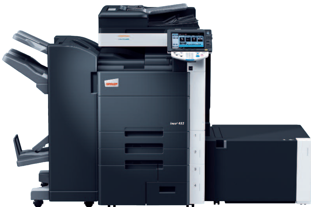
ineo+ 452 avec module de finition agrafage (FS-527), kit brochure (SD-509) et magasin latéral grande capacité (LU-204)