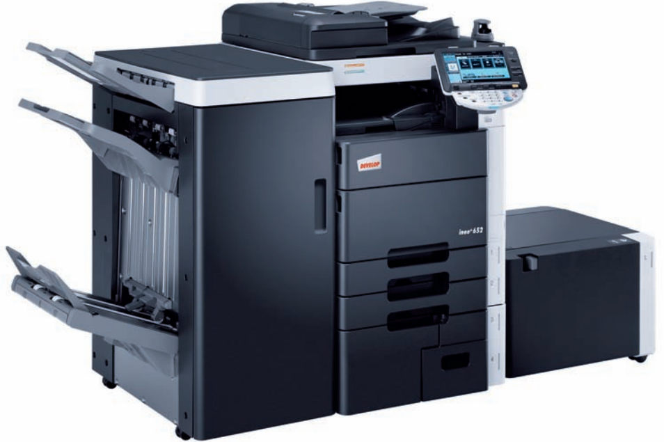
ineo+ 652 avec module de finition agrafage (FS-523), kit brochure (SD-508), tablette support (WT-506), kit d'authentification biométrique (AU-102) et magasin latéral grande capacité (LU-204)