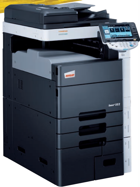
ineo+ 552 avec réceptacle copie (OT-503)