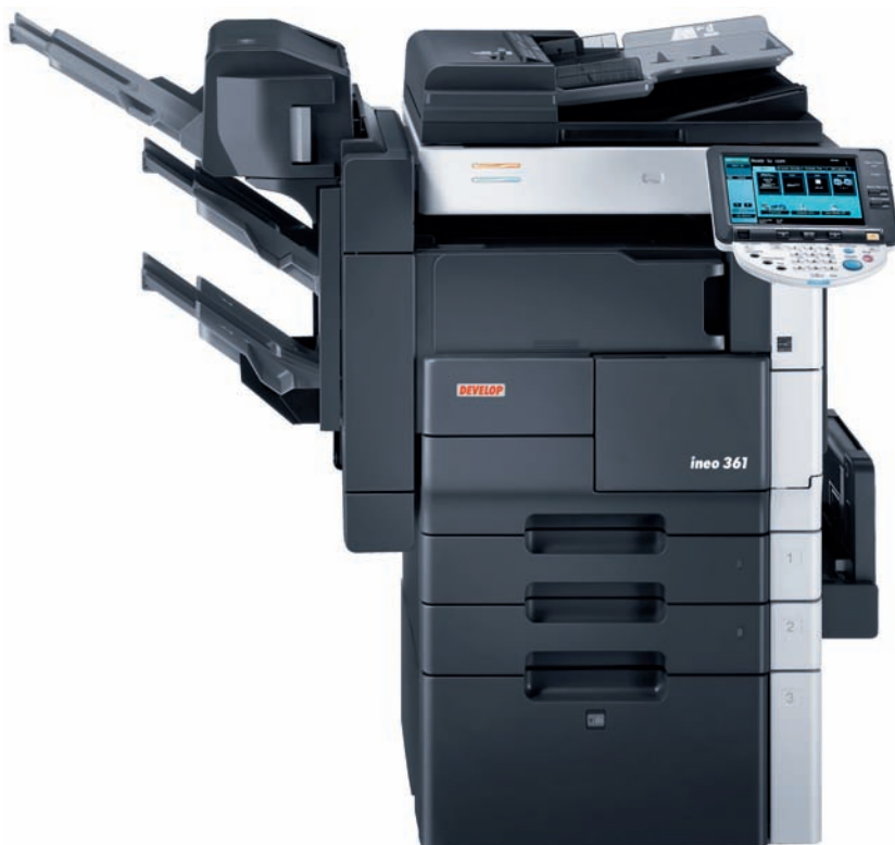
ineo 361 avec module de finition intégré FS-522, kit brochure SD-507 et magasin grande capacité PC-407

En plus de fonctions riches et diverses, les ineo 361/421/501 sont véritablement compacts grâce notamment à un module de finition intégré et sans pied, les plates-formes sont très simples d'utilisation et intuitives grâce à un panneau de commande repensé : large, tactile et couleur. Dans le monde monotone du monochrome, ces ineo se distinguent grâce à des fonctionnalités exceptionnelles.