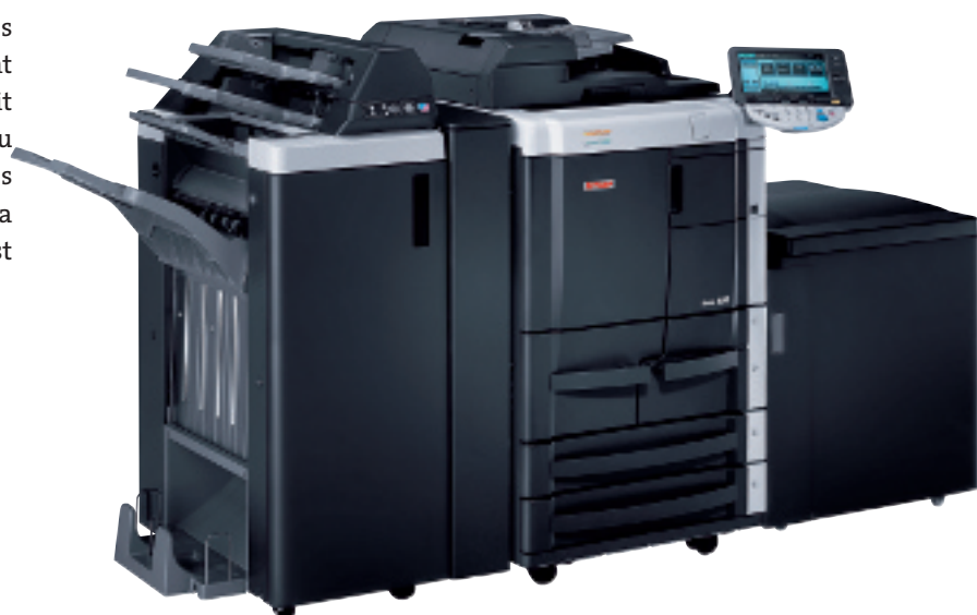
ineo 601 avec module de finition livret FS-610, bac d'insertion hors-four PI-604 et magasin grande capacité LU-405