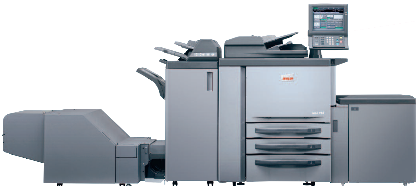
ineo 950 avec module de finition livrets FS-611, insertion hors four PI-506, magasin latéral grande capacité LU-408 et unité de massicot de chasse TU-502

Si votre entreprise croît, il vous suffit d'associer un second ineo 950 au premier et ainsi doubler votre production. Le logiciel d'impression en tandem – normalement très coûteux – est ici préinstallé en standard dans le système, vous avez alors uniquement besoin d'un câble Ethernet et du contrôleur ineo afin de décupler votre vitesse de production. Deux ineo 950 peuvent alors imprimer à 190 pages par minute, vitesse dont vous avez besoin pour produire des documents haut volume en un rien de temps. L'impression en tandem fait de l'ineo 950 un réel système de production très haut volume. Voici l'une des nombreuses raisons d'investir dans ce système.