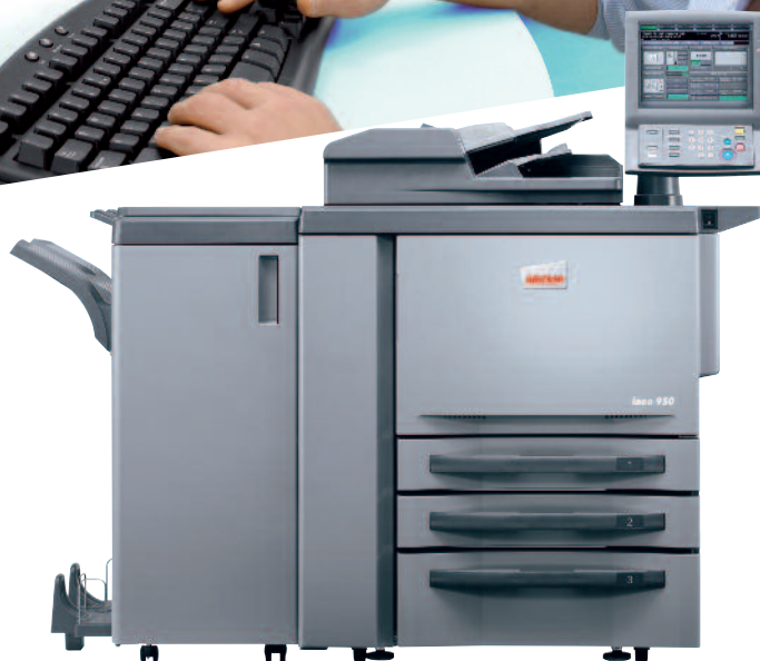
ineo 950 avec module de finition livret FS-611