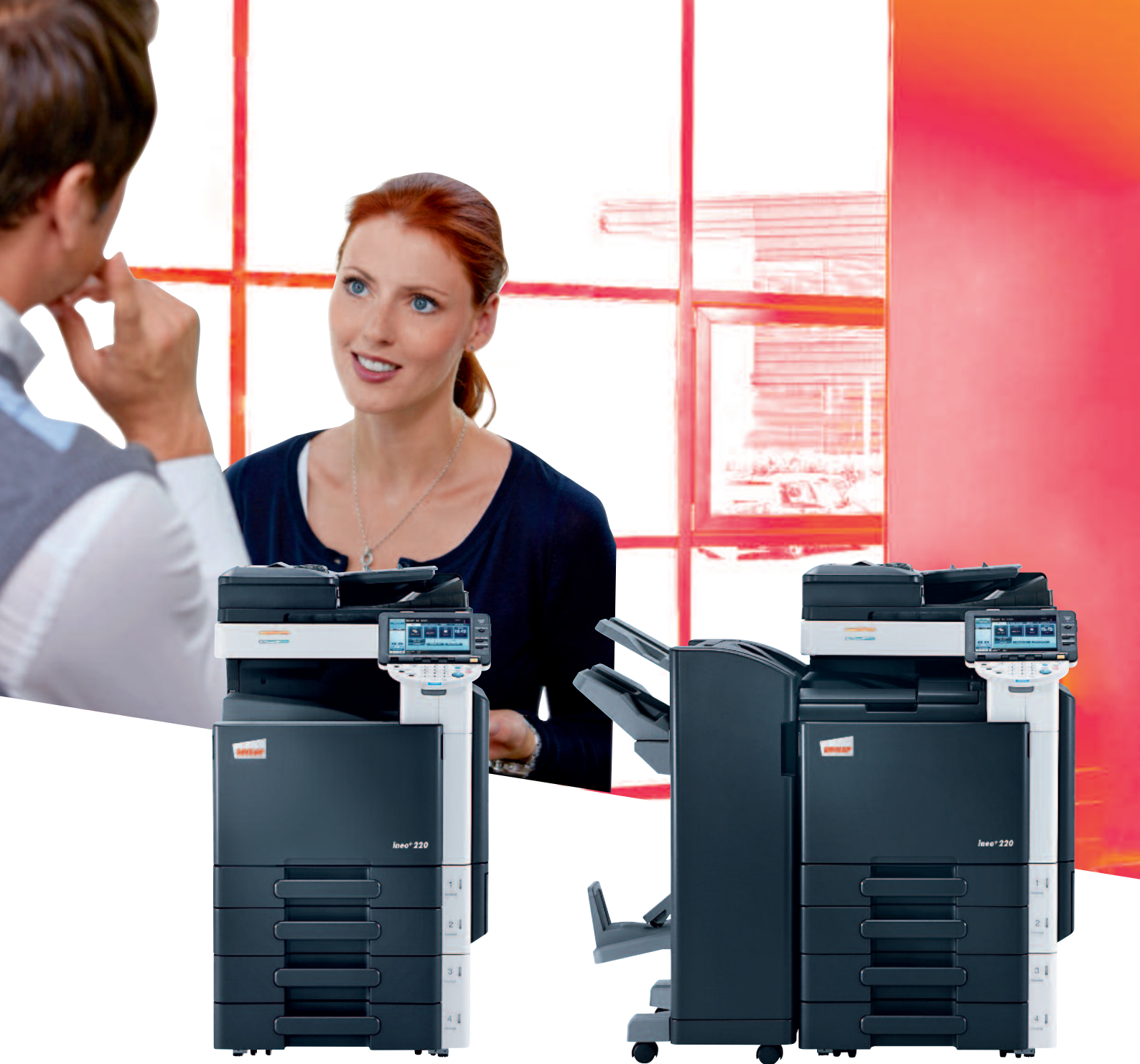
ineo+ 220 avec chargeur de documents (DF-617) et magasin papier 2x500 feuilles (PC-207)