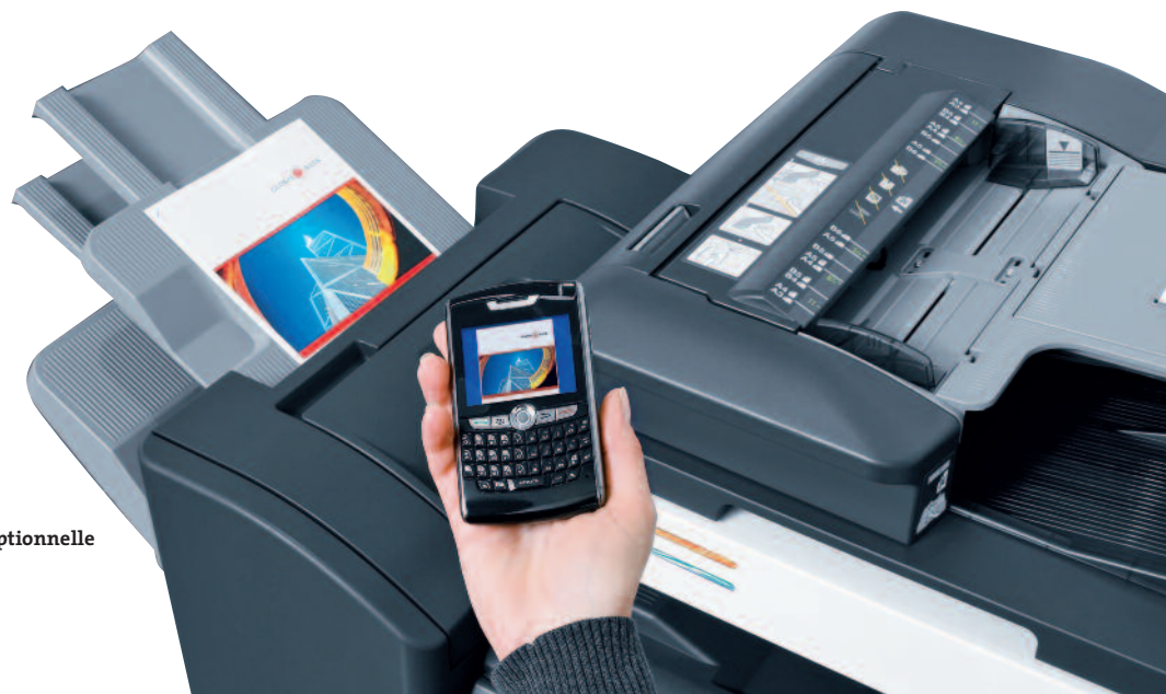
Impression nomade via la connexion Bluetooth optionnelle